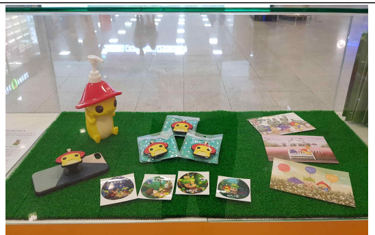
꽃자왈을 소재로 제작한 3D 애니메이션 '비밀의 바람숲' (7분 x 12편)