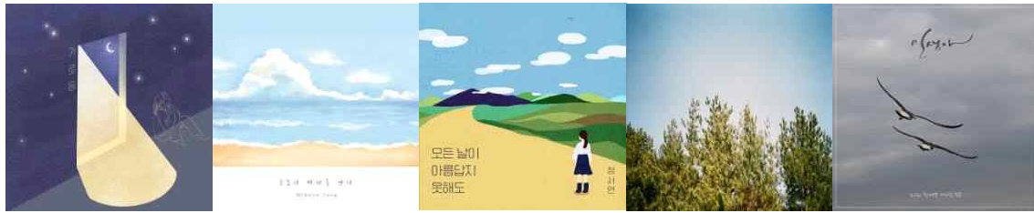
김은영 <가로등> 정미현 <구름이 바다를 만나> 정서연 <모든날이 아름답지 못해도> 조수경 <어쩌면 나는> 황재열 <인생아>